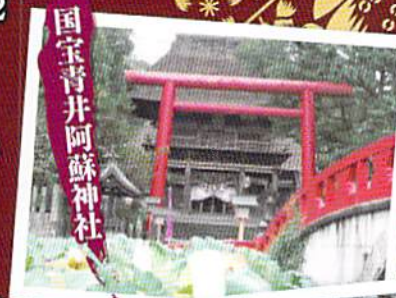
国宝青井阿蘇神社